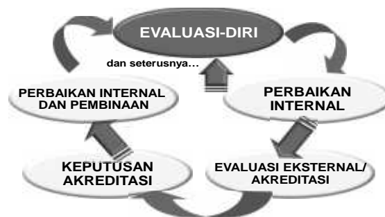
Bagan 1. Daur Penjaminan Mutu dalam Rangka Akreditasi

Seperti dikemukakan terdahulu, evaluasi-diri merupakan salah satu aspek penting dalam keseluruhan daur akreditasi dengan berbagai peran dan kegunaannya, termasuk penjaminan mutu ( quality assurance ). Keseluruhan daur penjaminan mutu dalam rangka akreditasi program studi/ perguruan tinggi itu dilukiskan dalam Bagan 1.